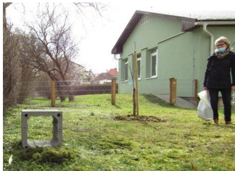
MŠ U JESLÍ